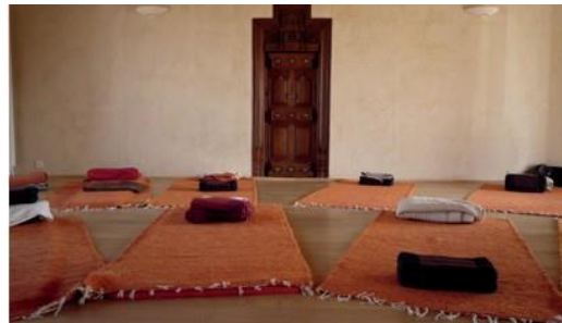
Somapa – lieu de formation

L'enseignement du Nidrâ Yoga vise à donner à chacun la pleine capacité de ses actes, paroles et pensées afin de les mettre au service du dépassement des vues étriquées sur soi-même et/ou sur le monde. « Chercher à percevoir la réalité sans artifice développe la faculté de réaliser la dimension naturellement sacrée de la vie. »